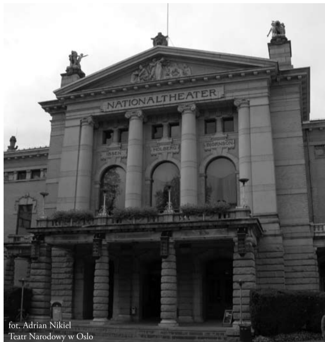
Teatr Narodowy w Oslo